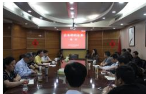
企业解决实际等问题与公司高层领导展开了亲切交谈和热烈讨论。